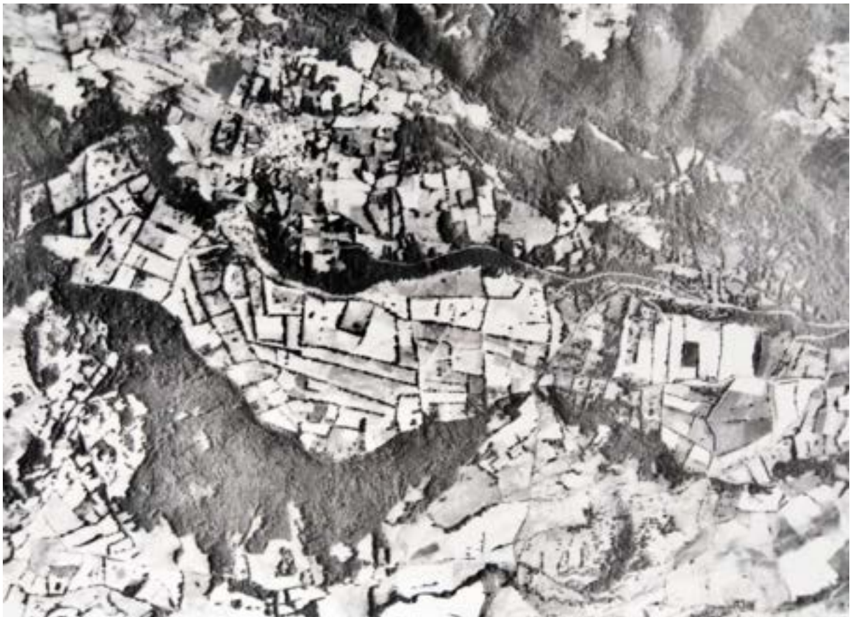
Vue aérienne du plateau de Ternant

Le réseau des murs délimite des parcelles irrégulières de forme quadrangulaire et d'assez grandes dimensions. Au début du XIXe siècle, la plupart d'entre elles étaient divisées en parcelles plus petites, limitées par quelques alignements de pierres et quelques rideaux de faible hauteur, correspondant à une étape plus récente de la mise en valeur. Les remembrements contemporains ont respecté ou reconstitué l'ancien parcellaire limité par les murs rectilignes, qui l'avaient fossilisé en raison de leur masse difficilement à déplacer ou à détruire.