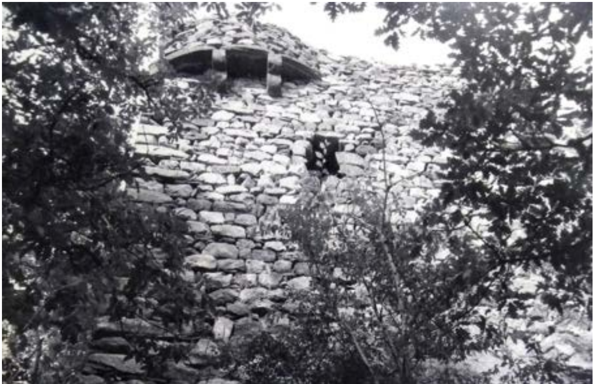
Ruines du Chastelet

Les ruines du Chastelet subsistent dans la vallée au pied de Dauzat, sous forme de murs surmontés d'échauguettes : elles évoquent un édifice seigneurial qui pourrait avoir été comparable à celui qui existait à Ternant.