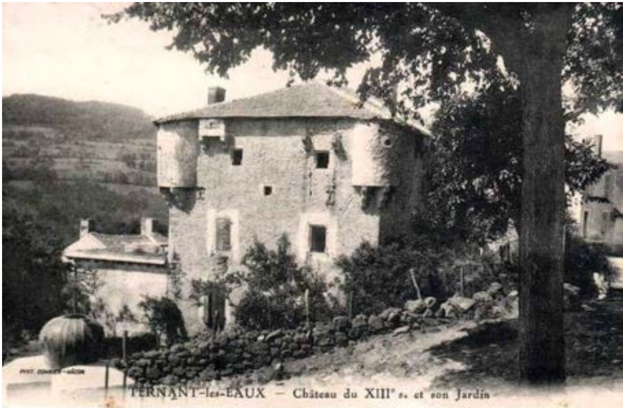
L'ancien château de Ternant-les-Eaux, sur l'emplacement de la mairie actuelle. Carte postale (avant 1953)

Le grand édifice fortifié aurait-il abrité les loges, des maisons étant construites dans la basse-cour ? On en est réduit à des hypothèses, étant entendu que tout donne à penser que c'est dans ce quartier qu'il faut chercher l'emplacement du fort encore visible au XVIIe siècle.